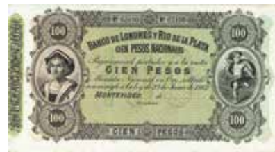
Los-Nr. 536 Banco de Londres y Rio de la Plata. 100 Pesos Nacionales. Montevideo, 23. Juni 1862. Blankett. Pick 245. Ausruf in CHF: 80 Erhaltung: EF+