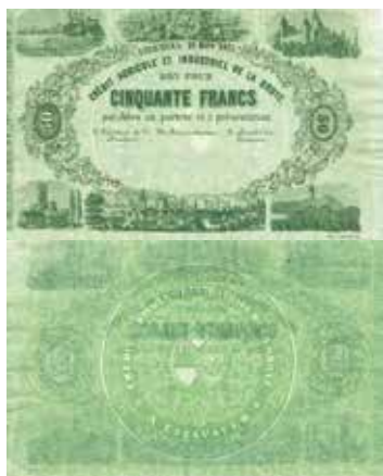
Los-Nr. 523 Crédit Agricole et Industriel de la Broye Bon pour 50 Francs. Estavayer, 28. März 1877. Ausruf in CHF: 250 Erhaltung: UNC