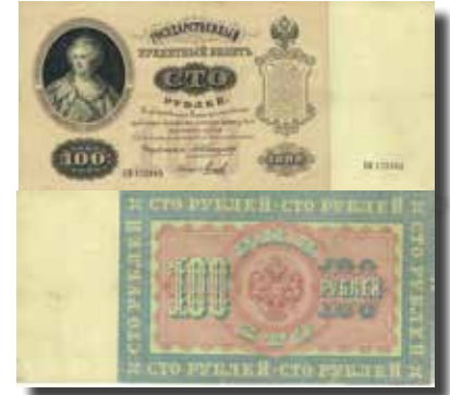
Los-Nr. 518 100 Rubel. 1898. Nr. KN175942. Porträt von Zarin Katharina die Grosse. Ausruf in CHF: Erhaltung: VF