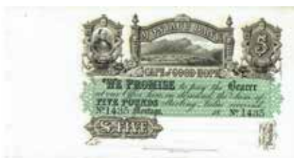
Los-Nr. 532 Montagu Bank Cape of Good Hope. 5 Pfund. Blankett. Pick S.231r. Ausruf in CHF: 100 Erhaltung: UNC