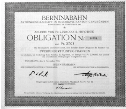
Obligation über 250 Franken. Poschiavo, 6.11.1933.

Nachdem im November 1904 der Versuch eines internationalen Konsortiums zur Gründung einer Bahngesellschaft gescheitert war, gelang es einer initiativen Schweizergruppe im Laufe des Jahres 1905 mit tatkräftiger Hilfe der Schweizerischen Eisenbahnbank in Basel und ihr nahestehender Basler Kapitalisten die Finanzierung des Berninaprojekts zu sichern. Die konstituierende Generalversammlung fand am