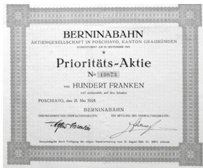
Prioritätsaktie über 100 Franken. Poschiavo, 21. Mai 1924.

Das Kapital betrug neu Fr. 4.26 Mio. in Prioritätsaktien und Fr. 0.901 Mio. in Stammaktien, die in Fr. 4.26 Mio. Prioritätsaktien der RhB und Fr. 0.901 Mio. Stammaktien der RhB umgetauscht wurden.