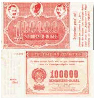
Los-Nr. 524 Propaganda-Schein / -note. 100'000 Schweizer Rubel. 1922. Ausruf in CHF: 50 Erhaltung: VF