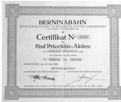
Zertifikat über 5 Prioritätsaktien. Poschiavo, 21. Mai 1924