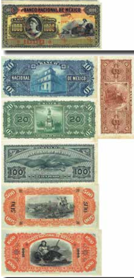
Los-Nr. 515 Estados Unidos Mexicanos. Banco Nacional de Mexico. Lot: 5, 10, 20, 50, 100, 500 und 1'000 Pesos. Nicht ausgegebene Reminder. Keine Signaturen und Ausgabedaten. Ausruf in CHF: 350 Erhaltung: UNC