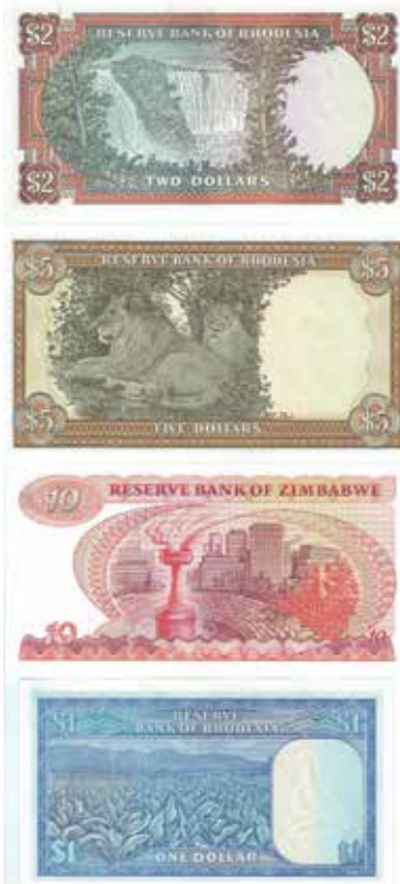
Los-Nr. 517 Reserve Bank of Rhodesia 1 Dollar, Salisbury 2. August 1979. P30, P34 - 2 Dollar, Salisbury, 24. Mai 1979. P31, P35 - 5 Dollar, Salisbury, 20. Oktober 1978. P32, P36. Reserve Bank of Zimbabwe 10 Dollar, Salisbury 1980. P.3. Total 4 Stück. Ausruf in CHF: 80 Erhaltung: UNC