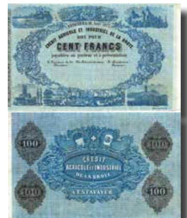
Los-Nr. 521 Crédit Agricole et Industriel de la Broye Bon pour 100 Francs. Estavayer, 28. Août 1872. Ausruf in CHF: 250 Erhaltung: UNC