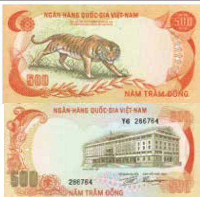
Los-Nr. 533 Lot: 25 Stück. Ngân-Hàng Quốc-Gia Việt-nam. 500 Dong. (1972). Nr. Y6 286764/88. Pick 33. Ausruf in CHF: 50 Erhaltung: UNC