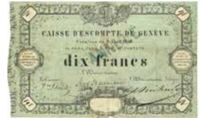
Los-Nr. 519 Caisse d'Escompte de Genève. 10 Franken. 1856. Stempel ANNULE. Pick S311.b. Ausruf in CHF: 100 Erhaltung: GOOD