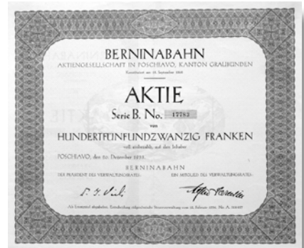
Aktie Serie B über 125 Franken. Poschiavo, 20. Dezember 1933

ist, dass sämtliche Verwaltungsräte, mit Ausnahme Arthur Forbes aus London, aus Zürich und Basel kamen. Bis Ende 1906 waren 60 % des Aktienkapitals einbezahlt; am 30. Juni 1908 wurde die letzte Rate eingefordert. Gleichzeitig wurde mit der Eisenbahnbank eine 4.5%ige Anleihe über 7 Mio. Franken aufgenommen.