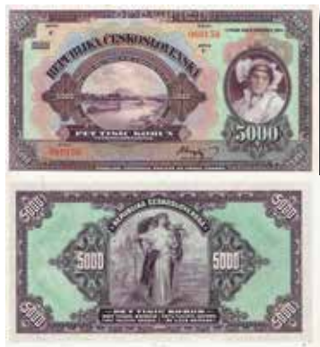
Los-Nr. 535 5'000 Kronen. SPECIMEN. 6. Juli 1920. Nr. 060159 Serie C. Ausruf in CHF: 80 Erhaltung: UNC