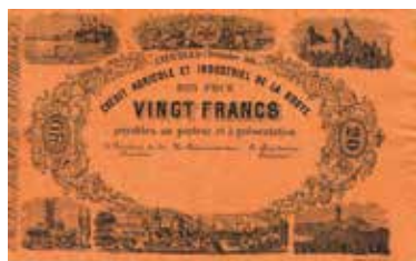
Los-Nr. 522 Crédit Agricole et Industriel de la Broye Bon pour 20 Francs. Estavayer, 1. Décembre 1866. Ausruf in CHF: 250 Erhaltung: UNC