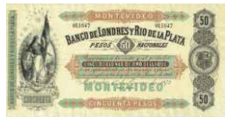
Los-Nr. 537 Banco de Londres y Rio de la Plata. 50 Pesos Nacionales oder 5 Golddublonen. Montevideo, 1. Januar 1872. Pick 238. Ausruf in CHF: 70 Erhaltung: EF+

Aktuelle News finden Sie unter www.hiwepa.ch