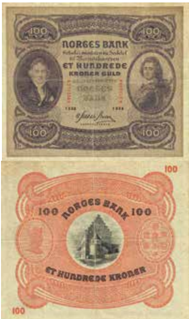
Los-Nr. 516 Norges Bank. 100 Kronen. 1938. Nr. B275058. Pick 10.c Ausruf in CHF: 100 Erhaltung: VF