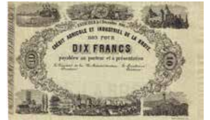
Los-Nr. 520 Crédit Agricole et Industriel de la Broye Bon pour 10 Francs. Estavayer, 1. Décembre 1866. Ausruf in CHF: 250 Erhaltung: UNC