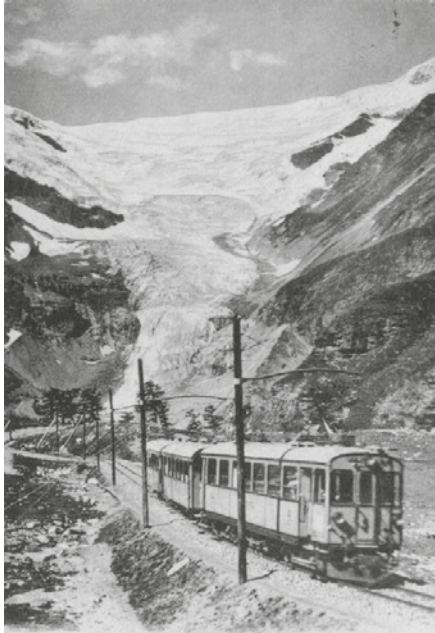
Berninabahn mit Palügletscher

Neben den grossen Alpentransitbahnen St. Gotthard, Simplon, Brenner und Mont Cenis gibt es im schweizerischen Alpengebiet noch eine weitere Nord-Süd-Route: Die Bernina-Strecke der Rhätischen Bahn. Die rund 61 Kilometer lange Verbindung von St. Moritz in das italienische Tirano ist ein technisches Wunderwerk in einer eindrucksvollen Landschaft.