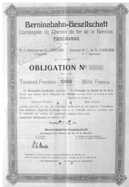
Obligation über 1'000 Franken. Poschiavo, 3.6.1908. Älteste verfügbarer Titel der Berninabahn.