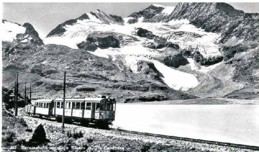
Berninabahn vor Lago Bianco und mit Piz Cambrena

In den Folgejahren konnte die Bahn erhebliche Überschüsse erzielen; für das Prioritätskapital wurden sogar Dividenden gezahlt. Mit dem Einfluss des ersten Weltkrieges kamen Schwierigkeiten. Am 01.03.1917 wurden die Zinszahlungen eingestellt und gestundet. Am 03.04.1922 trat ein ungeduldig gewordener Besitzer